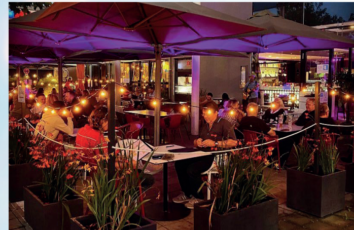
Drinnen wie draußen gemütlich: Das Marco's am Westpark.